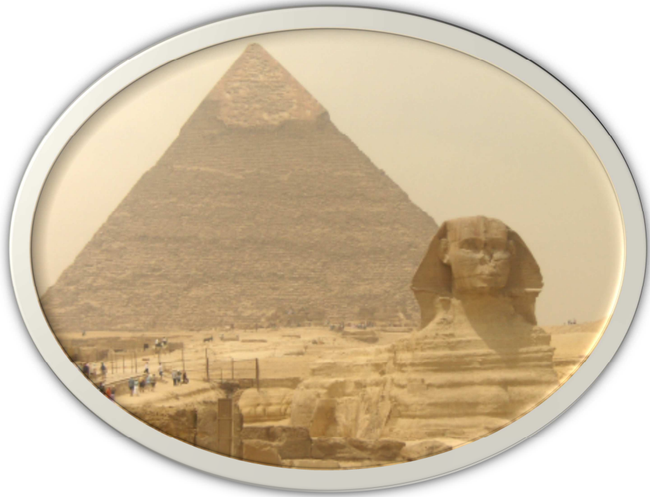
Foto: Sphinx von Gizeh , im Hintergrund die Pyramide des Cheops / Gize'deki Keops Piramiti ve önüdeki Sifenks

Mısır inancına göre Firavunlar ölümsüzdü, onların bu dünyadan ayrıldıktan sonra da halklarını görüp takip ettiklerine inanılırdı. Mısırlılar, firavunların ebedi huzurunu sağlamak ve onları mezar hırsızlarından koruyabilmek için iki ayrı yöntem geliştirmişlerdi. Bu yöntemlerden birincisi firavunlar için yapılan taştan piramitlerdi. Birinci krallık döneminde (MÖ 2650) yapılmaya başlanan piramitlerin sayısı 100'den fazladır. En tanınmış olanları ise; Gize'de bulunan Keops Piramiti'dir. Bu piramit aynı zamanda dünyanın 7 harikasından birisidir.