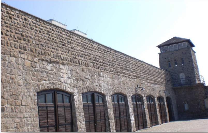
Konzentrationslager Mauthausen in Österreich Avusturya'daki Toplama ve İmha Kampı

Günümüzde Holokost veya Şoa ; Naziler tarafından Avrupa'da yaşayan Yahudilerin katledilmesine verilen isimdir. 1939-1942 yılları arasında Yahudiler, Almanların yaşadığı yerlerden uzaklarda inşa edilmiş varoşlara veya toplama kamplarına yerleştirilmiştir. 1942'de Nasyonal Sosyalistler Wannsee Konferansı'nda Avrupa'daki bütün Yahudilerin öldürülmesini kararlaştırdılar. Bu amaç için Avrupa'nın birçok ülkesinde inşa edilen toplama kampları daha sonra imha kamplarına dönüştürüldü.