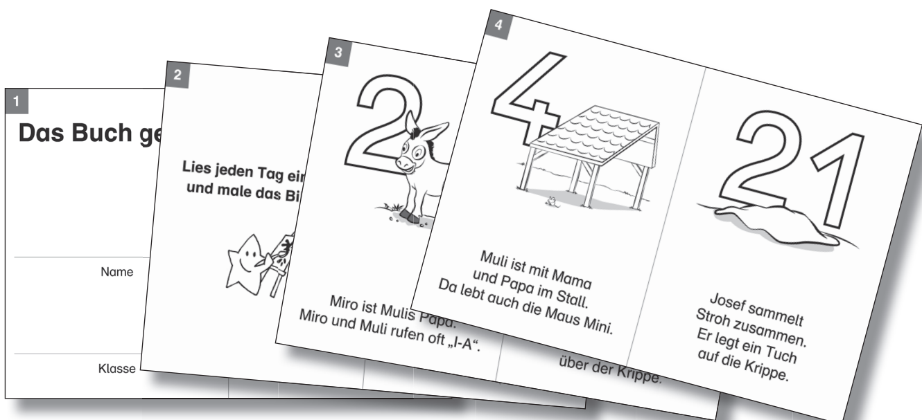
Anordnung/Sortierung der Seiten des Adventskalenders im Hosentaschenformat