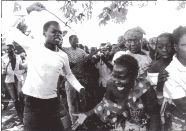
Vor dem Lagerhaus in Goma haben sich zahlreiche hungernde Menschen versammelt. Mit Knüppeln versuchen Männer die Hungernden zurückzuhalten.