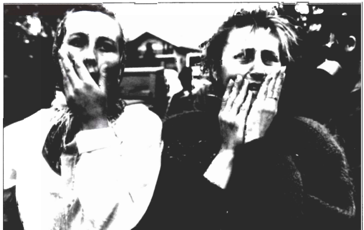
Zwei Frauen müssen mitansehen, wie die Leichen ihrer Ehemänner von einem Lastwagen abgeladen werden.

Seit der Gründung der Organisation hat sich die Lage weltweit kaum verbessert.