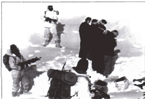
Im Zuge einer Operation gegen die PKK im Südosten der Türkei haben die Sicherheitskräfte mehrere Personen festgenommen.

In jeder Minute stirbt auf der Welt ein Mensch durch den Einsatz einer Schusswaffe.