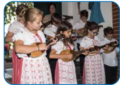
13.2: Kroatische Minderheit im Burgenland