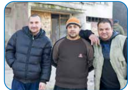
13.4: Roma in der Ostslowakei