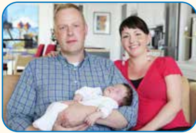
12.1: Däne und Grönländerin

Unterschiede in Sprache und Kultur grenzen die Regionen voneinander ab, gleichzeitig fühlen sich immer mehr Menschen auch als Europäerin oder Europäer: Die Idee eines „gemeinsamen Europa“ ist in der Europäischen Union bereits teilweise verwirklicht worden. Es ist kein Widerspruch, gleichzeitig Österreicherin oder Österreicher und Europäerin oder Europäer zu sein.