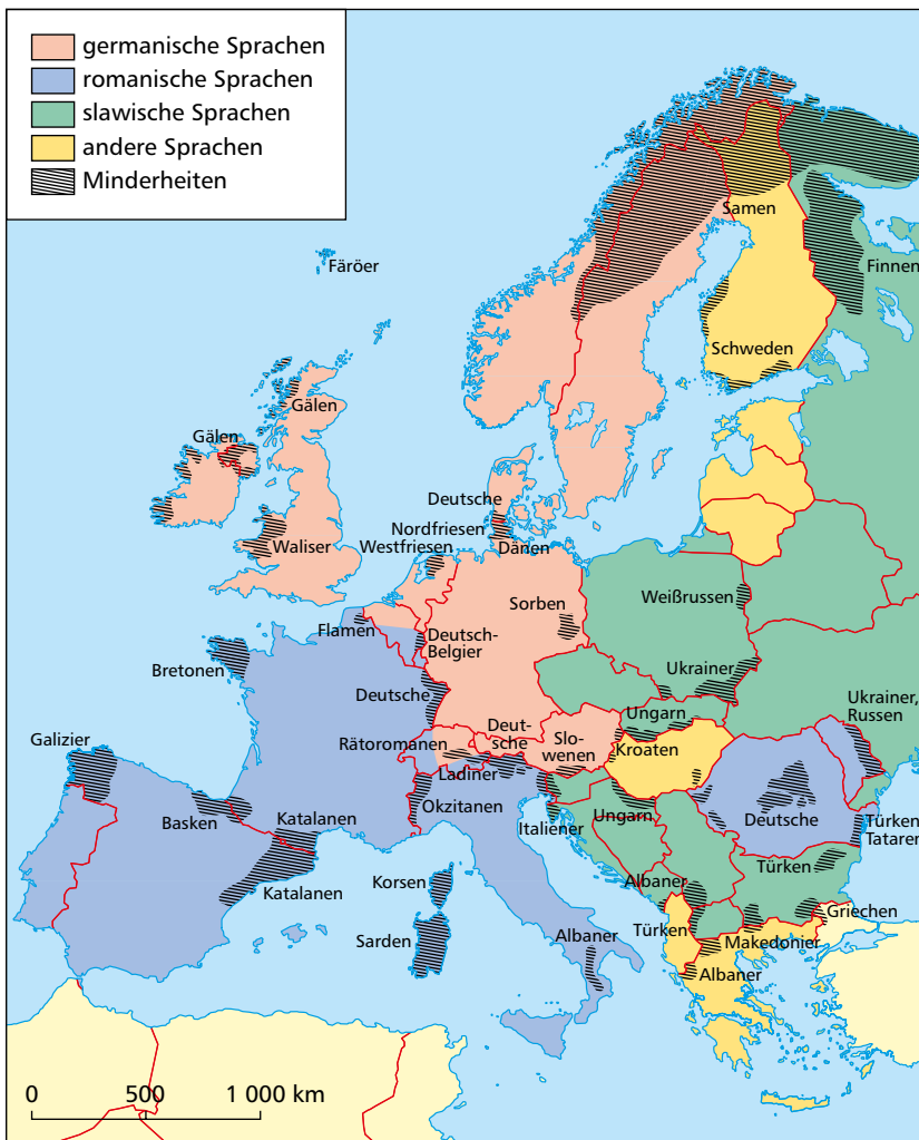
13.1: Sprachen und Minderheiten in Europa