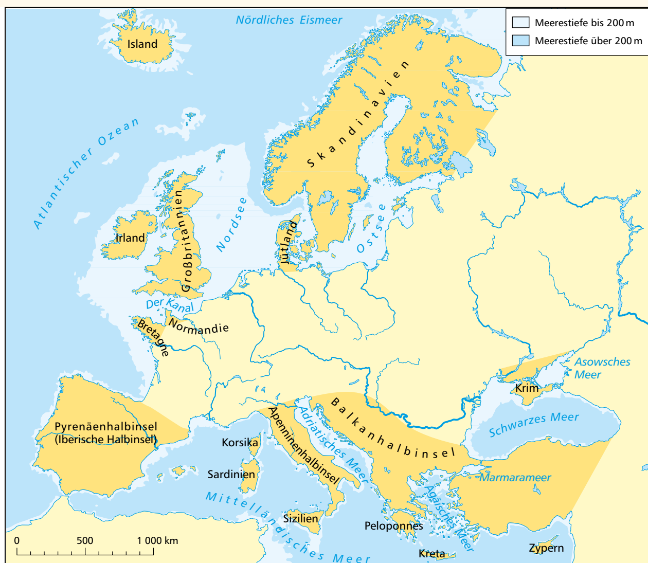
8.1: Inseln und Halbinseln

Zahlreiche Inseln liegen auf dem Kontinentalsockel. In den Eiszeiten – als der Meeresspiegel rund 100 m tiefer lag – waren viele der heutigen Inseln mit dem Festland verbunden (z.B. Großbritannien, Sizilien).