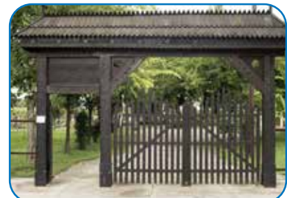
13.3: Typisches Tor der Szeklerminderheit in Serbien