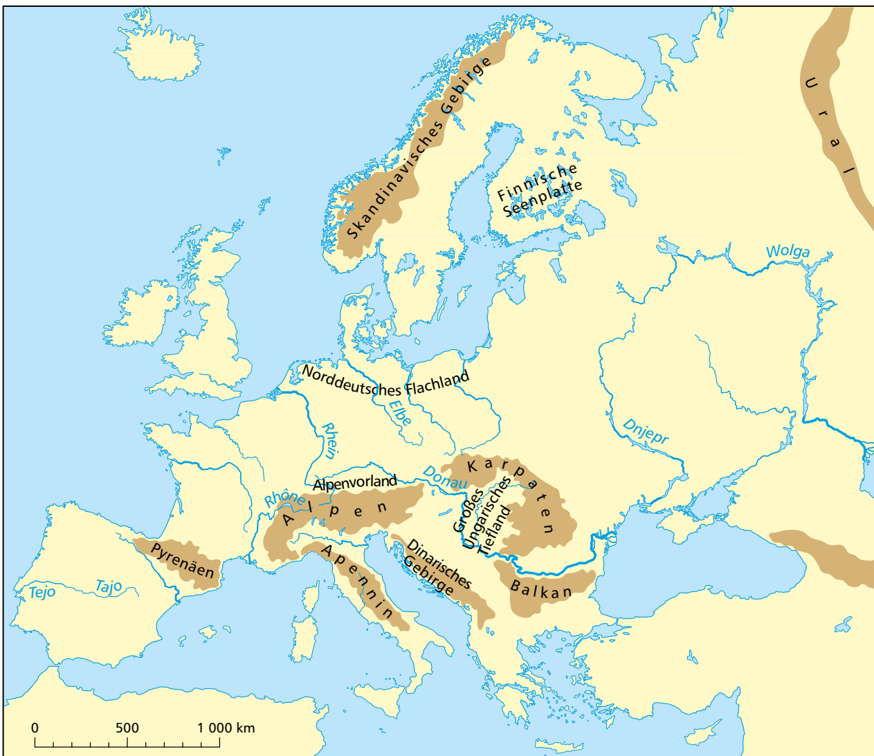
9.1: Gebirge, Landschaften, Flüsse

Gesteinsmaterial wird in den Gebirgen abgetragen und gelangt in die Täler. Die Flüsse bringen große Mengen an Schottern und Sanden in die Tiefländer und ins Meer. In den Tiefländern entstanden daraus weite Ebenen.