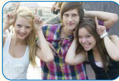
12.2: Jugendliche in Litauen